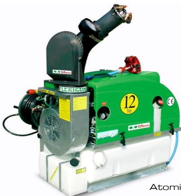
Atomizzatore per Disinfestazioni