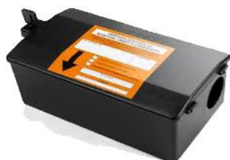
Erogatore esca topicida